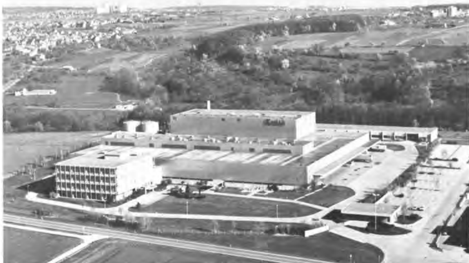
El centro de distribución de Kodak A.G. está en Scharnhausen. En el fondo pueden verse las afueras de Stuttgart.