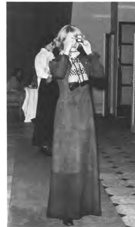
Una modelo toma una foto con la Cámara KODAK Pocket INSTAMATIC 200 durante un desfile de modas en Buenos Aires.

Así se hizo, y fue considerable el interés que la cámara suscitó.