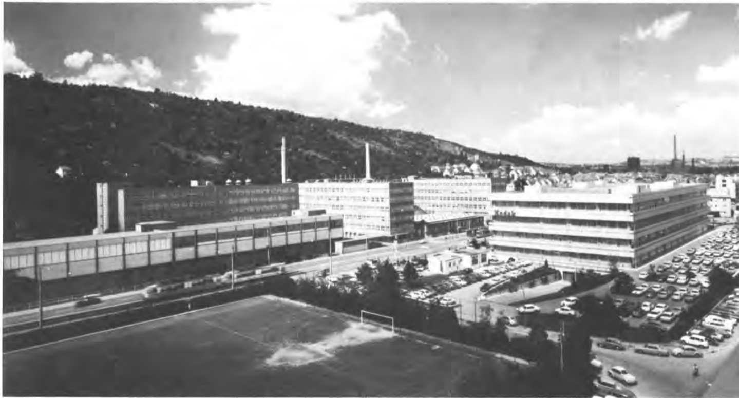
Las oficinas principales de Kodak A.G. están en Stuttgart, y adjuntas a ellas se yerguen las fábricas donde se producen la mayoría de las cámaras y proyectores de diapositivas de la compañía. También funciona allí el laboratorio de procesado y copia en color.