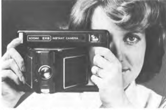
La Cámara KODAK EK8 Instant es uno de los más recientes productos de Kodak A.G.