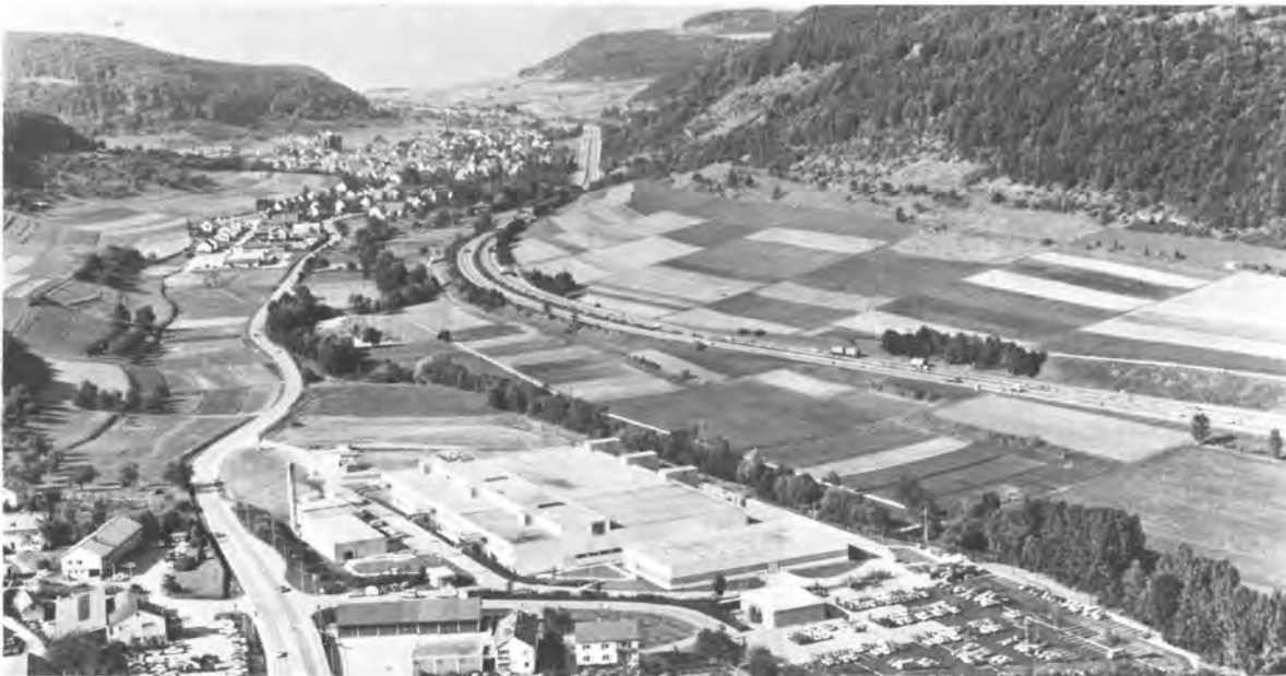
La fábrica de Mühlhausen/Gruibingen es la que produce la Cámara KODAK EK8 Instant.